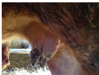
Atteinte de la mamelle