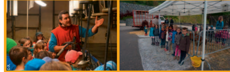
Visite d'une ferme pour l'école de Serraval (ci-dessous) et participation de la classe

Deux classes de l'école de Serraval (Grande section/CP et CP/CE1) ont participé à l'opération « Un berger dans mon école ». Ils ont reçu la visite d'un berger et sont allés visiter une ferme d'élevage. Pour la journée de partage au Villard-sur-Thône avec les autres écoles, les classes ont conçu et réalisé deux jeux : un jeu Questions pour un reblochon , sur le principe de Questions pour un champion , et La grande loterie. Le principe : tourner une roue pour tirer au sort un thème et répondre à une question. Ce jour là, chaque école tenait un stand et proposait aux autres de jouer à ses jeux.