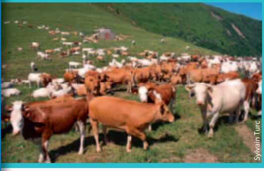
Visite de l'alpage du Sénépy en Isère.