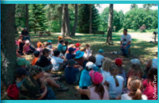
Les classes de l'école de La Motte-Saint-Martin dans le Champsaur