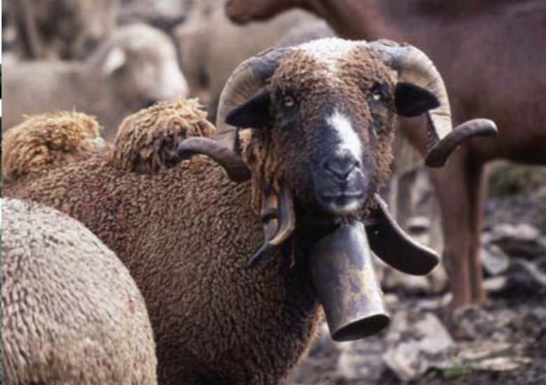
À gauche : chargement du troupeau en garde d'Arles, 1958 À droite : bélier conducteur du troupeau ou « fouca », Col du Glandon, Savoie