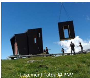
Logement Tatou

Le tatou : un logement innovant développé par le Parc National de la Vanoise et l'Ecole d'Architecture de Lyon et la SEA 73. Il est composé de 5 à 6 modules héliportables ne nécessitant pas de fondation ni de terrassement, ni d'autorisation d'urbanisme. Ce logement répond aux normes réglementaires concernant le logement des salariés agricoles.