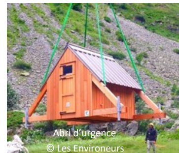
Abri d'urgence

Les abris d'urgences : des logements composés d'un module d'environ 6 m2 héliportable en une seule rotation. Ces logements ne répondent pas aux normes réglementaires concernant le logement des salariés agricoles. Ils sont complémentaires à un logement principal et permettent au berger de dormir au plus près du troupeau sur des quartiers excentrés de l'alpage.